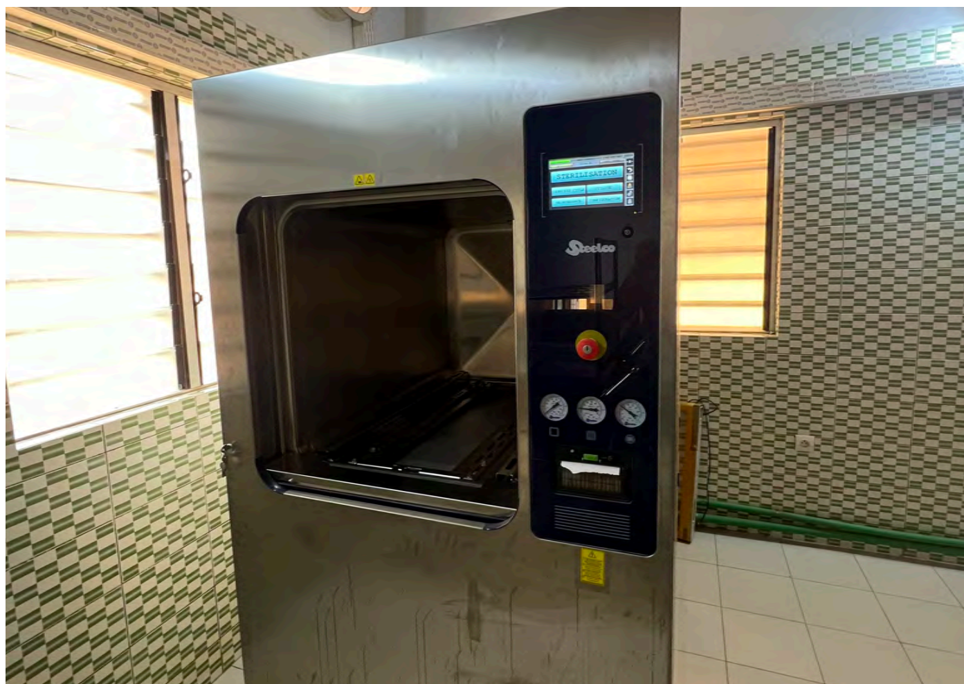
Nouvelle installation de stérilisation des instruments

font soigner sans pouvoir contribuer aux frais d'hospitalisation. La vocation de l'hôpital, donc de l'Ordre des Frères Hospitaliers de Saint Jean de Dieu, fait qu'on ne laisse pas les plus démunis à l'écart si bien que c'est le Fonds des Indigents qui doit se substituer au moment de devoir régler la facture. Les 3 fondations citées plus haut ont également contribué à parts égales à la rénovation de l'Unité de stérilisation du bloc opératoire dont les travaux sont terminés.