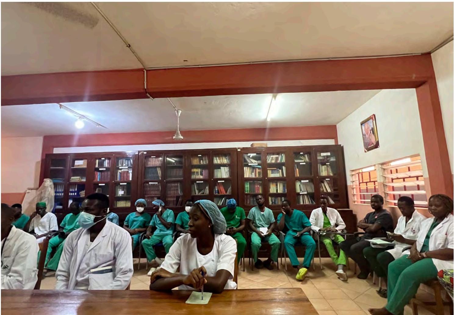
Réunion hebdomadaire du staff

Les bourses d'encadrement contribuent à l'activité de l'enseignement post-gradué dispensé par les médecins spécialistes dont l'équipe devrait s'étoffer prochainement d'un médecin anesthésiste.