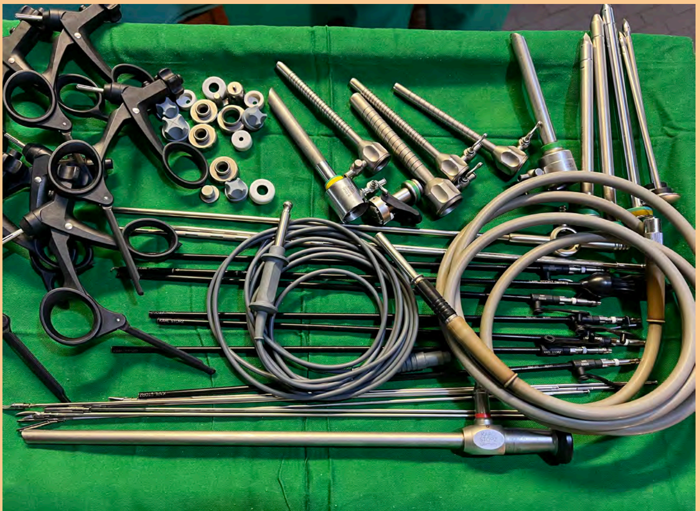
Plateau de chirurgie laparoscopique

En fin de mission nous faisons un tour de l'ensemble du matériel pour savoir ce qu'il faut compléter ou remplacer. Nous avons identifié la nécessité d'un deuxième endoscope pour constituer un deuxième plateau de laparoscopie.