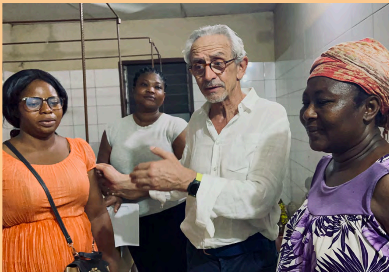
Équipe de la Fondation Claudine Talon qui accompagne les patientes avant et après leur opération