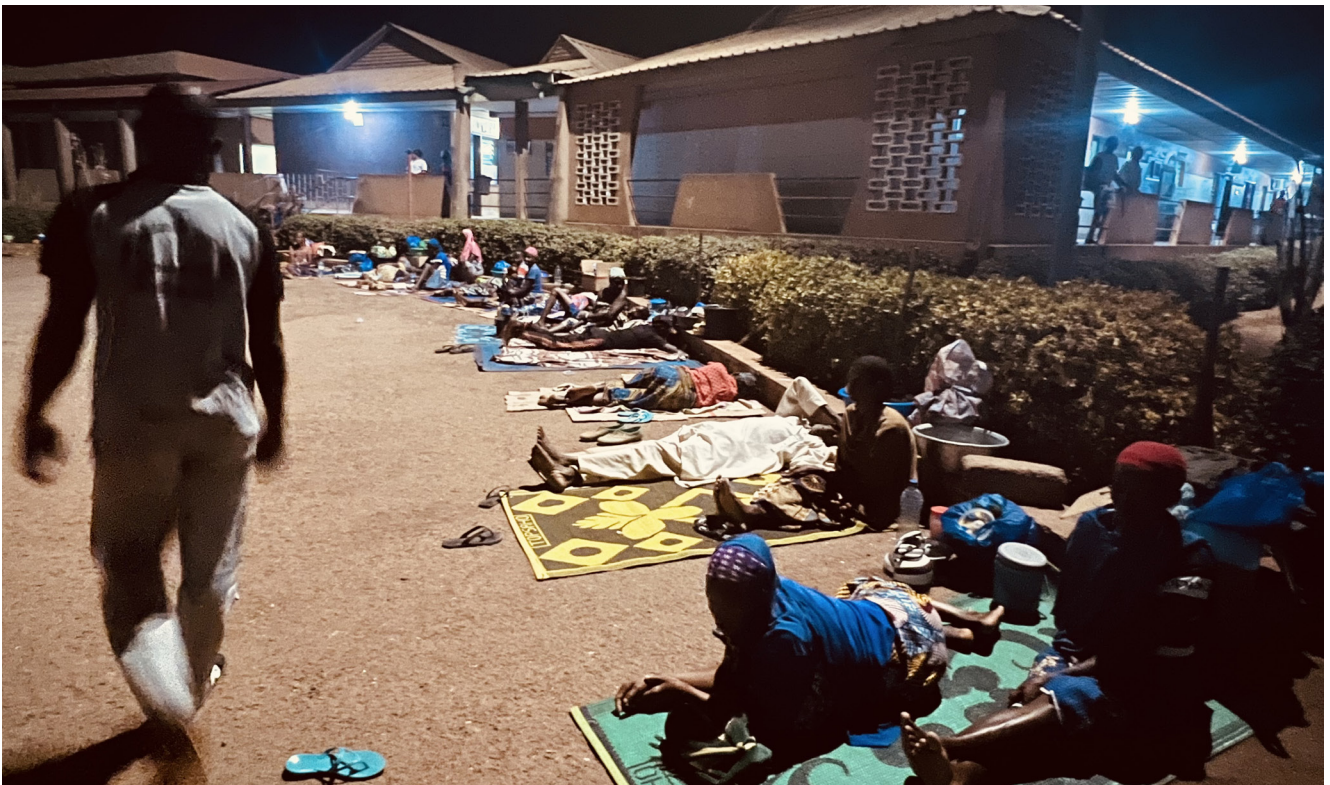
Les accompagnants dormant dans la cour de l'Hôpital Saint Jean de Dieu