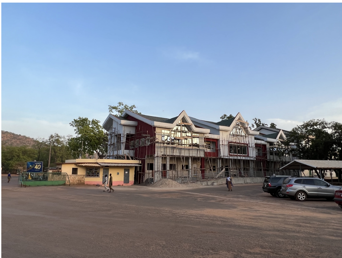
Rénovation de bâtiment de la clinique

La Fondation tient également à remercier Medtronic ainsi que la maison Anklin pour leur soutien en matériel.