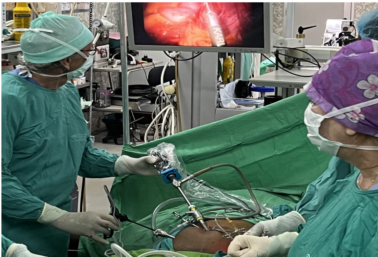
1ère opération laparoscopique à Tanguiéta en avril 2023

La laparoscopie requiert du CO2 ce qui était jusqu'à présent un facteur limitant. Ce gaz est désormais produit à Cotonou, permettant de régler les problèmes d'approvisionnement.