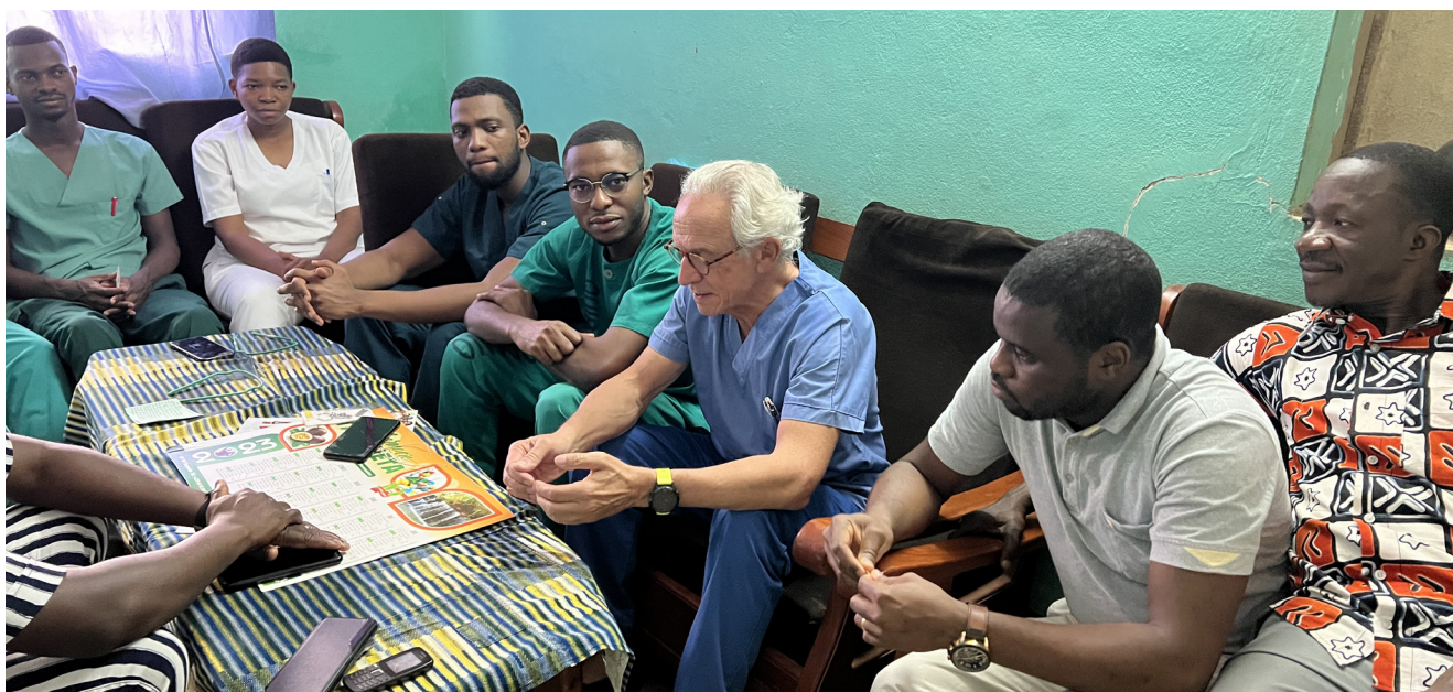
En 2023, nous avons introduit des primes pour l'encadrement clinique des médecins cadres